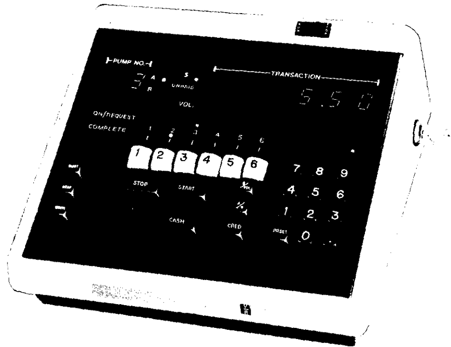
Cashier Console Pupitre de commande de caissier