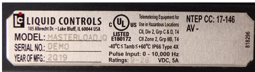
Figure 4 A nameplate example | Un échantillon de la plaque signalétique