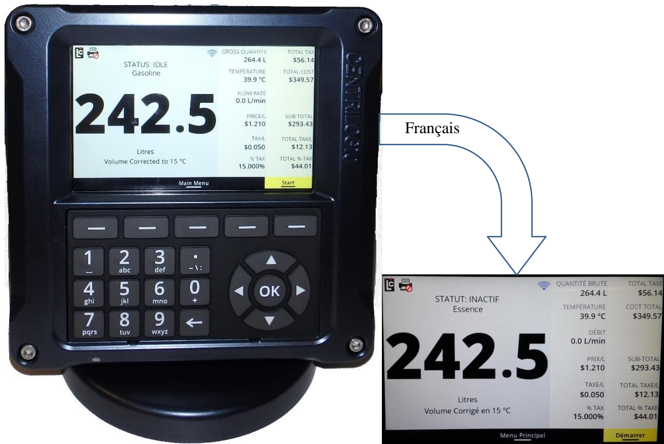
Figure 1 The LCR.iQ electronic register | L’enregistreur digital LCR.iQ

Remplacement d’une sonde de CAT nécessiterait de briser le sceau physique pour accéder aux connexions internes.