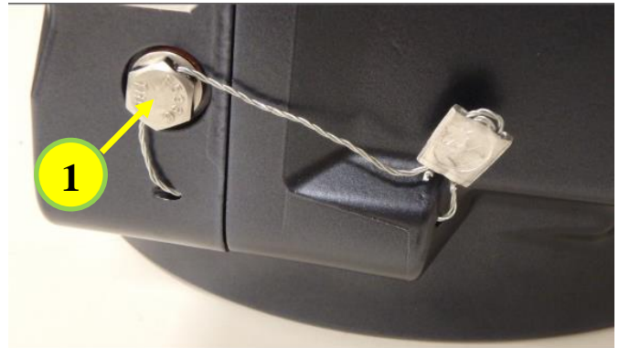
Figure 3 The seal on the calibration bolt '1' | Le sceau sur le boulon d'étalonnage '1'