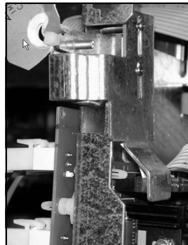
fig.3 normal/sealed position position normal/scellé