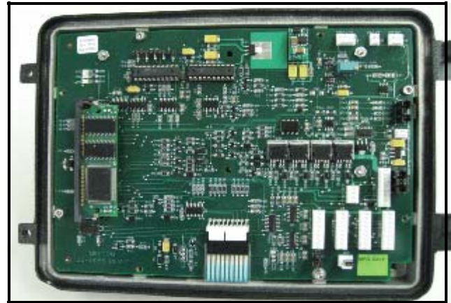
Fig. 5: E:Count MCR-05 circuit board with piggyback circuit incorporated into the main board/ Carte de circuits imprimés du E:Count avec carte ferroutière incorporé dans la carte primaire.

The piggyback board was incorporated into the main circuit board as shown in the diagram above.