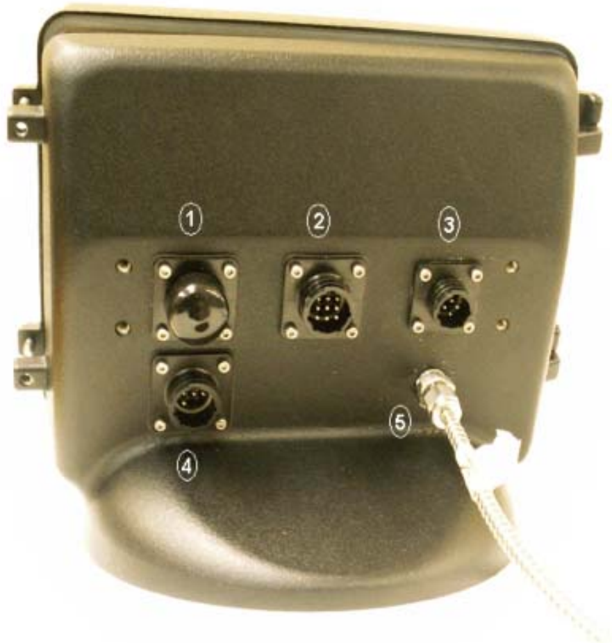
Fig. 2: Rear view of E:Count register / Vue arrière de l'enregistreur E:Count (MCR-05)