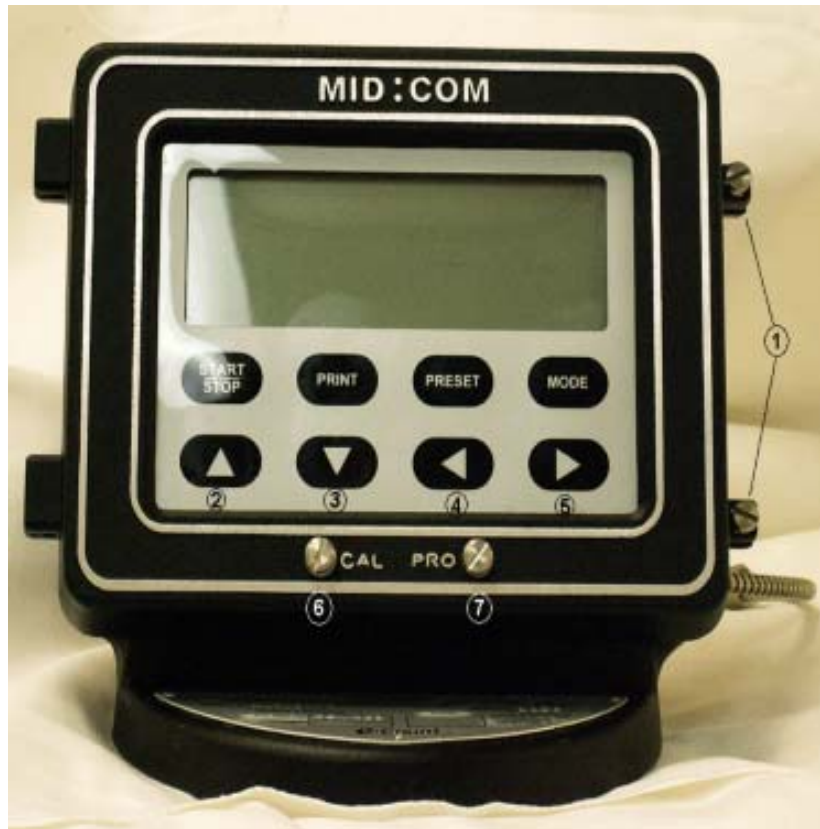
Fig 1: E:Count electronic register / L'enregistreur électronique E:Count (MCR-05)