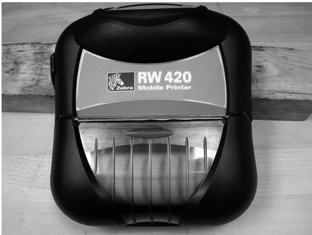
Fig 9 : Zebra printer / Imprimante Zebra