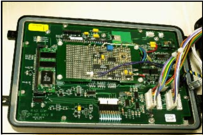
Fig. 4: E:Count MCR-05 circuit board with new temperature probe electronic components / Carte de circuits imprimés du E:Count avec composantes électroniques pour la nouvelle sonde thermométrique

As a result of a change in the type of temperature probes used with the E:Count register, additional electronic components were added to the original circuit board. These include a piggy back board with jumper wires connected to the appropriate points, as seen in the diagram above.