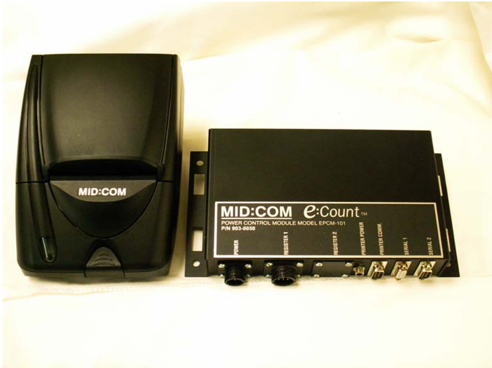
Fig 8 : Printer and EPCM Power control module imprimante et module de gestion de la puissance EPCM