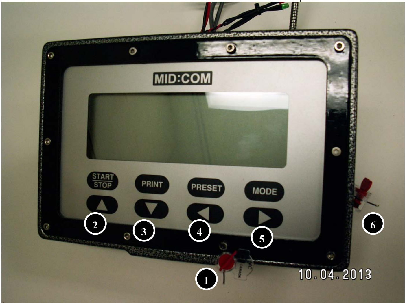
FIG. 3 : E :Count Electronic Register / Enregistreur Electronique E :Count (MCR-09)