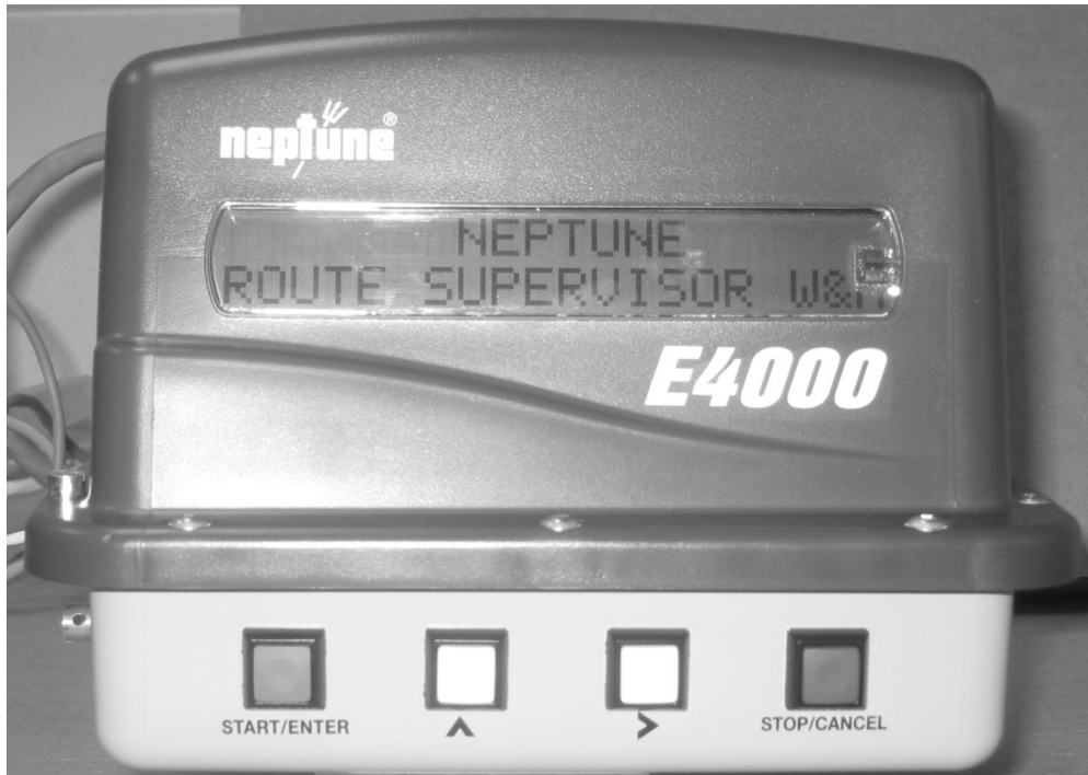
Fig. 1: Neptune E4000 Register / Enregistreur Neptune E4000