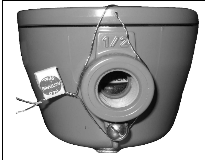
600588-000 New style of Weights & Measures seal / Nouveau style de sceau de Poids et Mesures