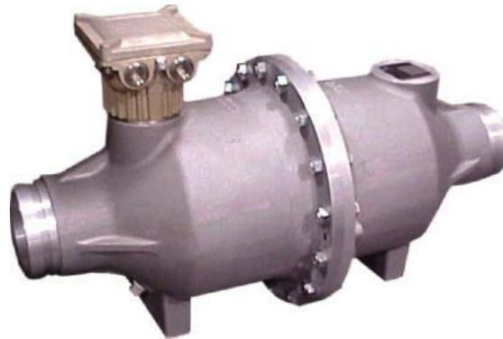
Figure 4 BiRotor Plus Non-Ferrous AB series | BiRotor Plus séries AB non-ferreux