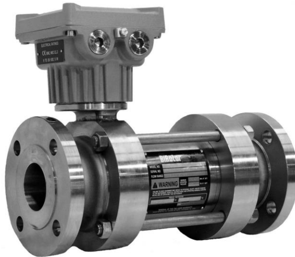
Figure 3 BiRotor Plus Single Cased SB series | BiRotor Plus séries SB de boîtier unique

* Non-metrological options | options non-métrologique