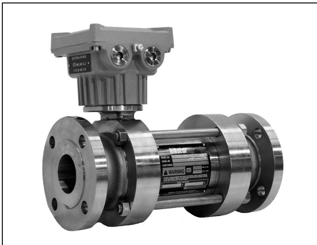
SB251 / SB254