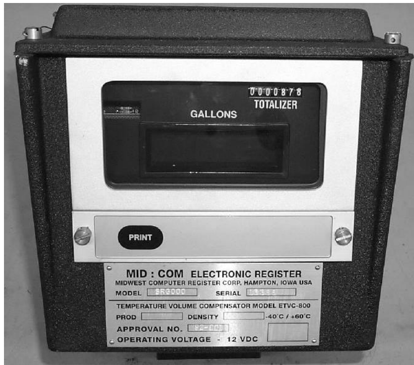
Figure 6: MID:COM 8000: with remote print button / avec une touche impression à distance