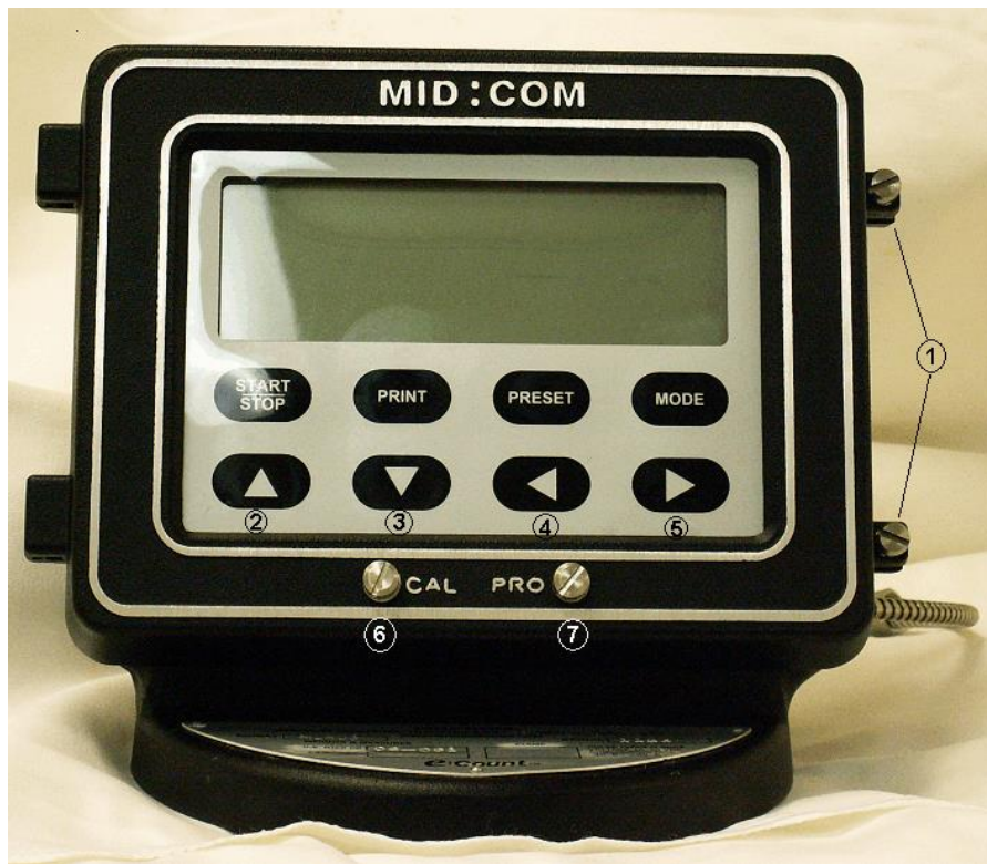
Figure 3: E:Count Electronic Register / L'enregistreur électronique E:Count