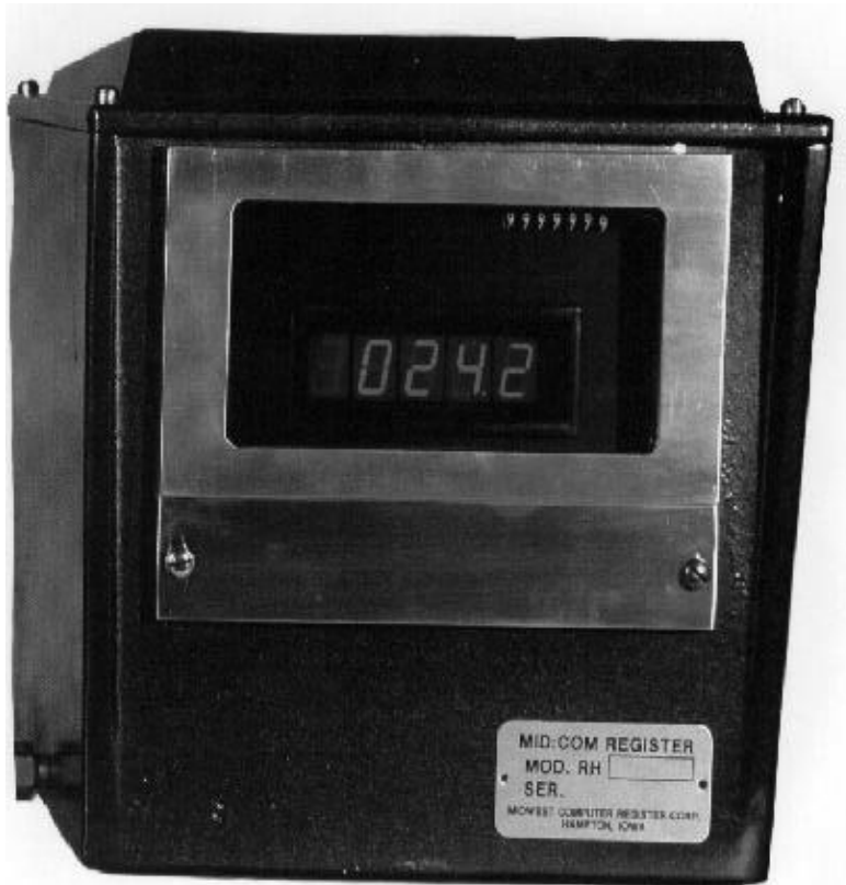
Figure 5: Register Model SR*-00*-*/ Enregistreur modèle SR*-00*-*