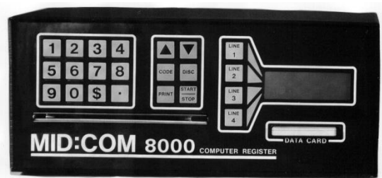
Figure 4: MID:COM 8000 Computer / Ordinateur MID:COM 8000

AV-2276 Rév. 10 Gurkan Yilmaz Métrologiste Légal Junior