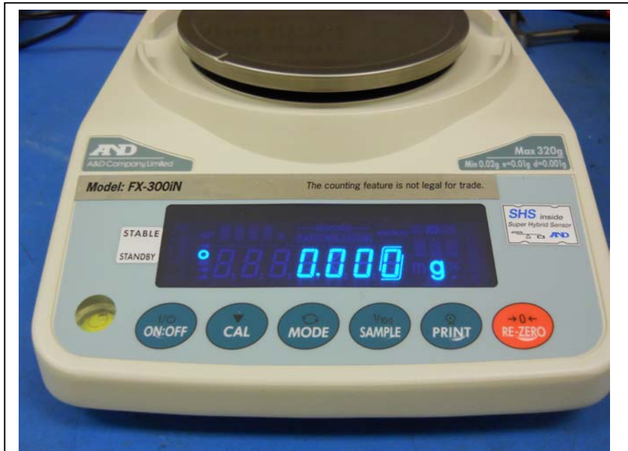
Typical display and keyboard / Affichage et touches typiques

Date: 2013-03-08 Dossier: 26686-AP-AM-12-0171