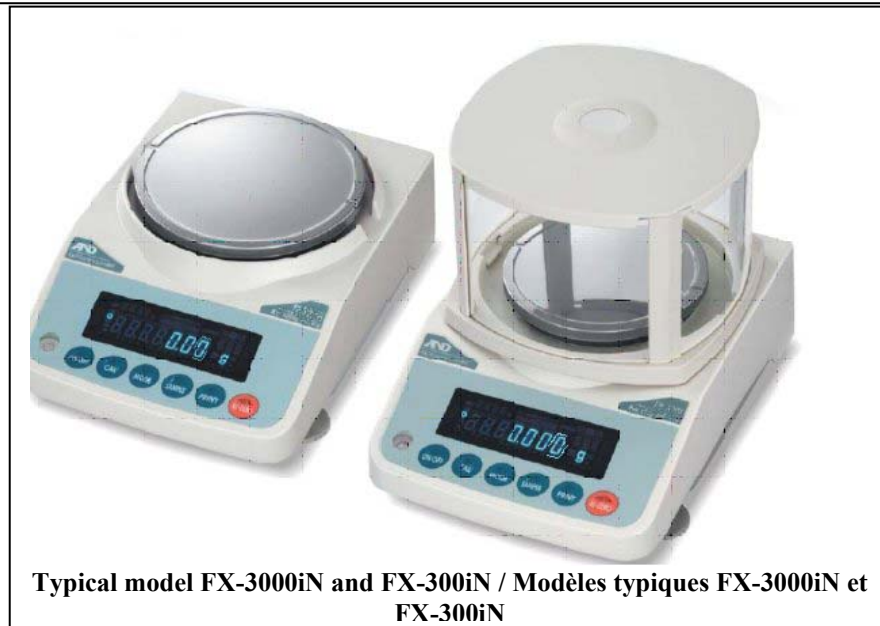
Typical model FX-3000iN and FX-300iN / Modèles typiques FX-3000iN et FX-300iN