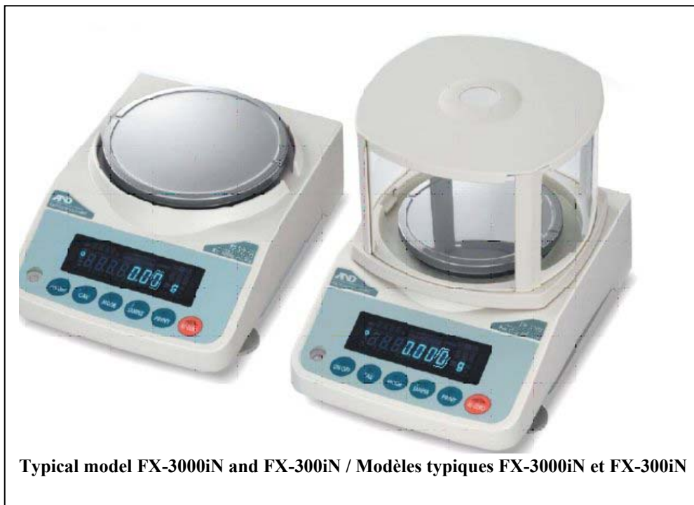
Typical model FX-3000iN and FX-300iN / Modèles typiques FX-3000iN et FX-300iN