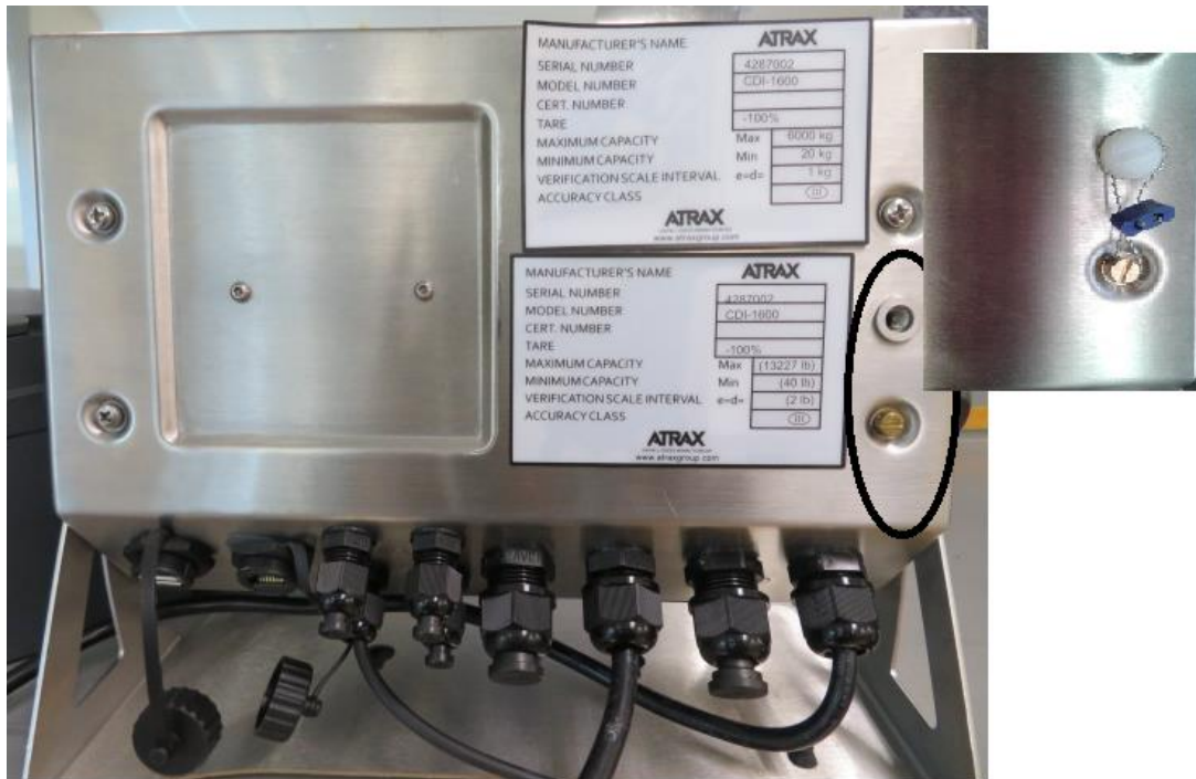
Typical Sealing / Scellage typique