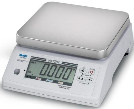
Typical PPC-300-II Model / Modèle typique PPC-300-II