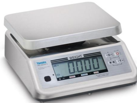
Typical PPC-300WP-II Model / Modèle typique PPC-300WP-II