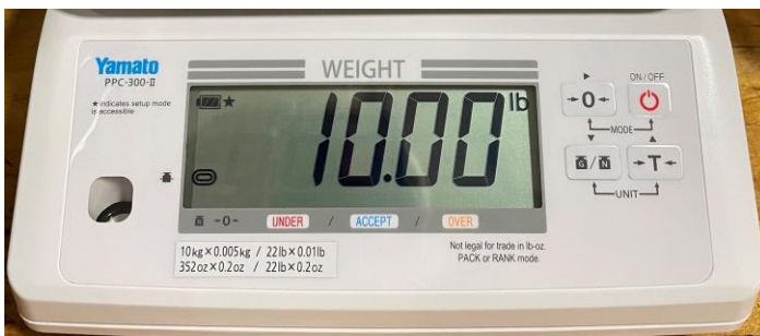
Typical Keyboard / Clavier typique