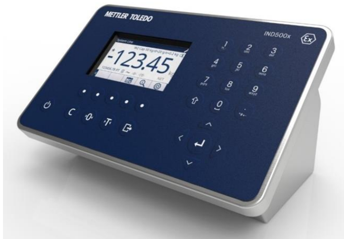
Typical Model / Modèle typique