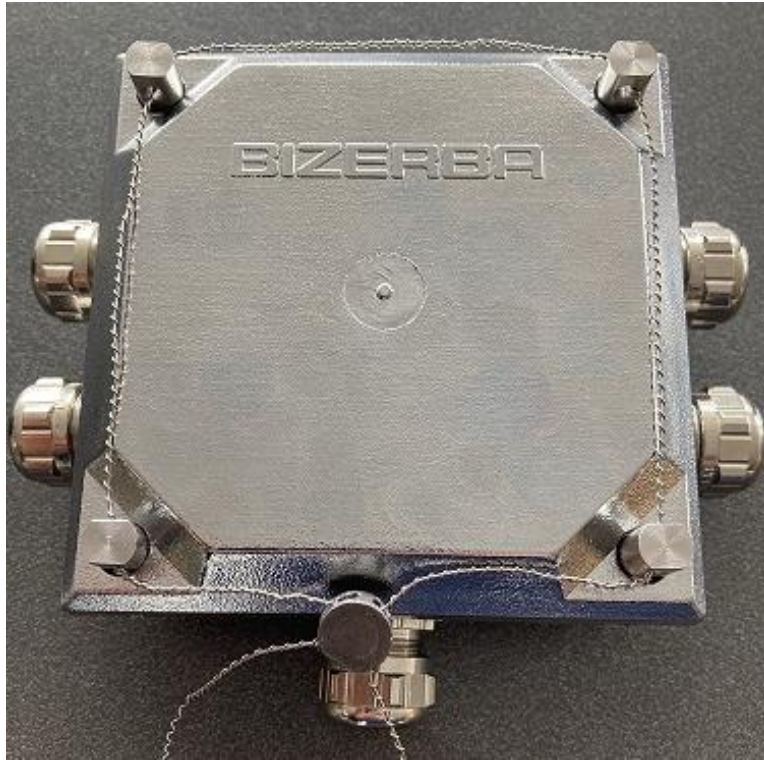
Typical sealing of the junction box / Scellage typique de la boîte de jonction