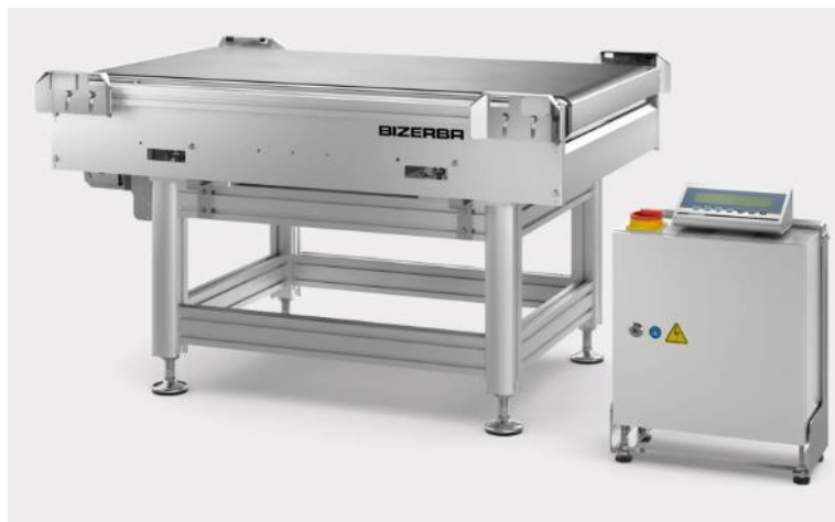
Typical CWL-L model / Modèle CWL-L typique