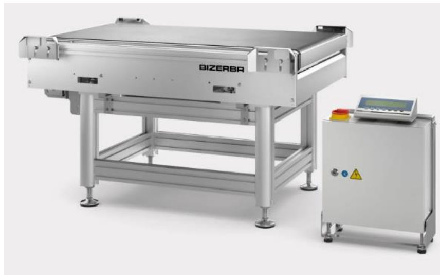
Typical CWL-L model / Modèle CWL-L typique