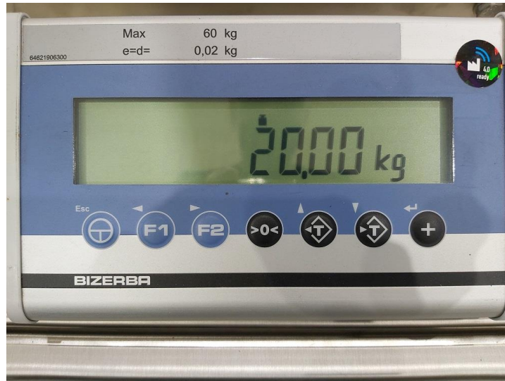
Typical Display / Afficheur typique