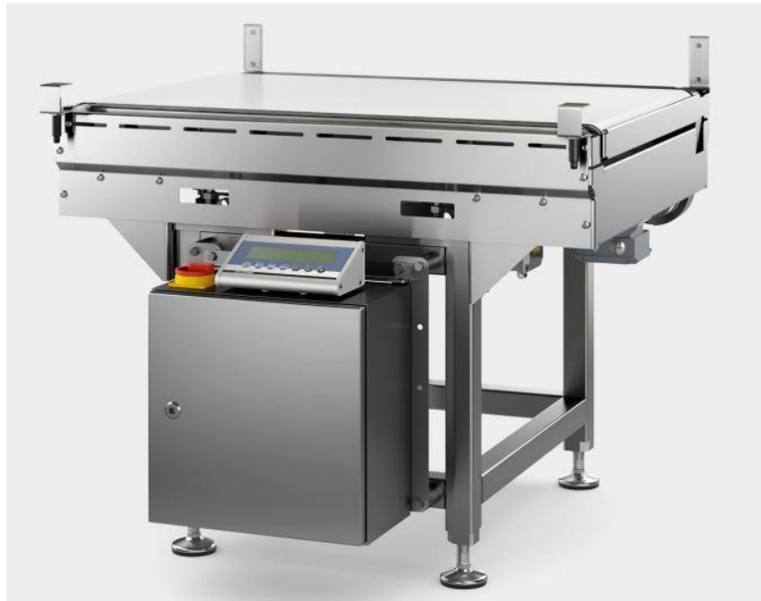
Typical CWL-I model / Modèle CWL-I typique