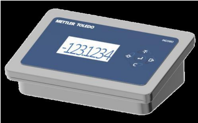
Typical Harsh Model / La modèle Harsh