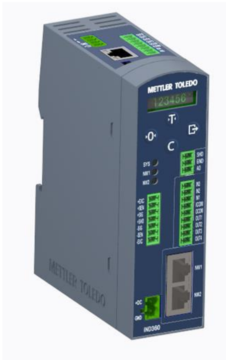
Typical DIN Rail Model / Modèle type de rail DIN