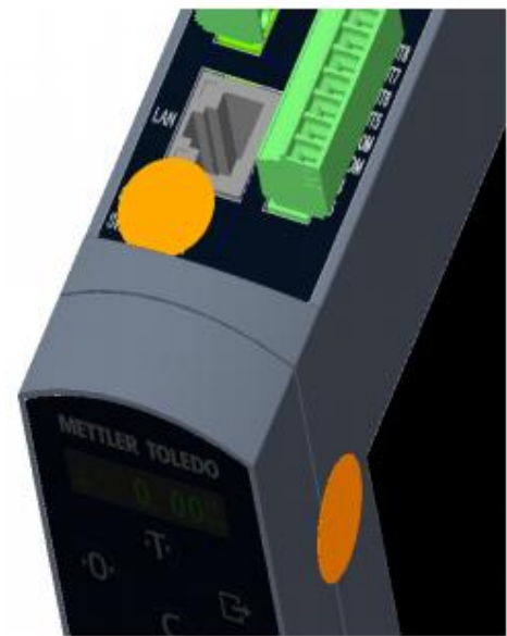
Typical DIN Rail Model Sealing / Scellage typique d'un modèle de rail DIN