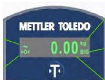
Typical DIN Rail Display / Affichage typique sur rail DIN