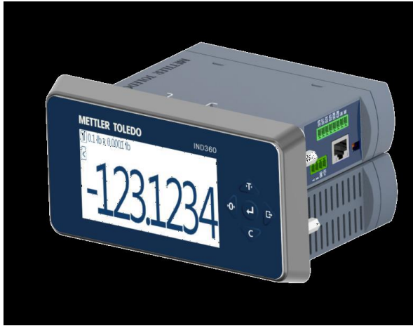
Typical Panel Mount Model / Modèle typique de montage sur panneau