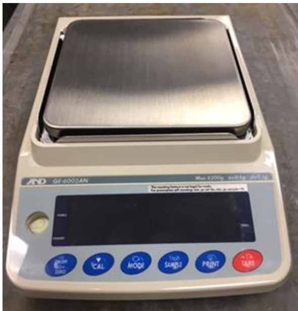
Typical device with 16.5 cm platter / Appareil avec un plateau de 16.5 cm typique