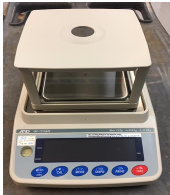
Typical device with 12.8 cm platter / Appareil avec un plateau de 12.8 cm typique