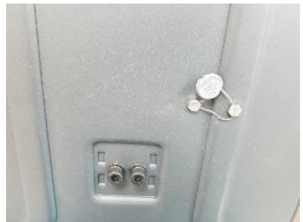
Typical Sealing / Scellage typique