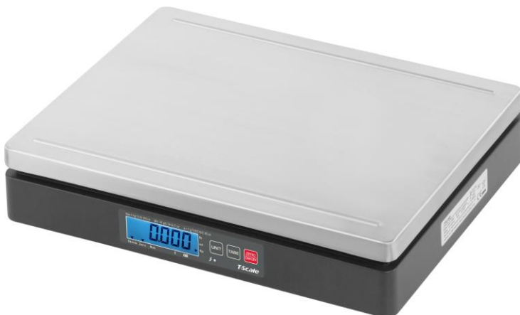
Typical Model DL-xy, DL-A-xy and DL-B-xy / Modèle typique DL-xy, DL-A-xy et DL-B-xy