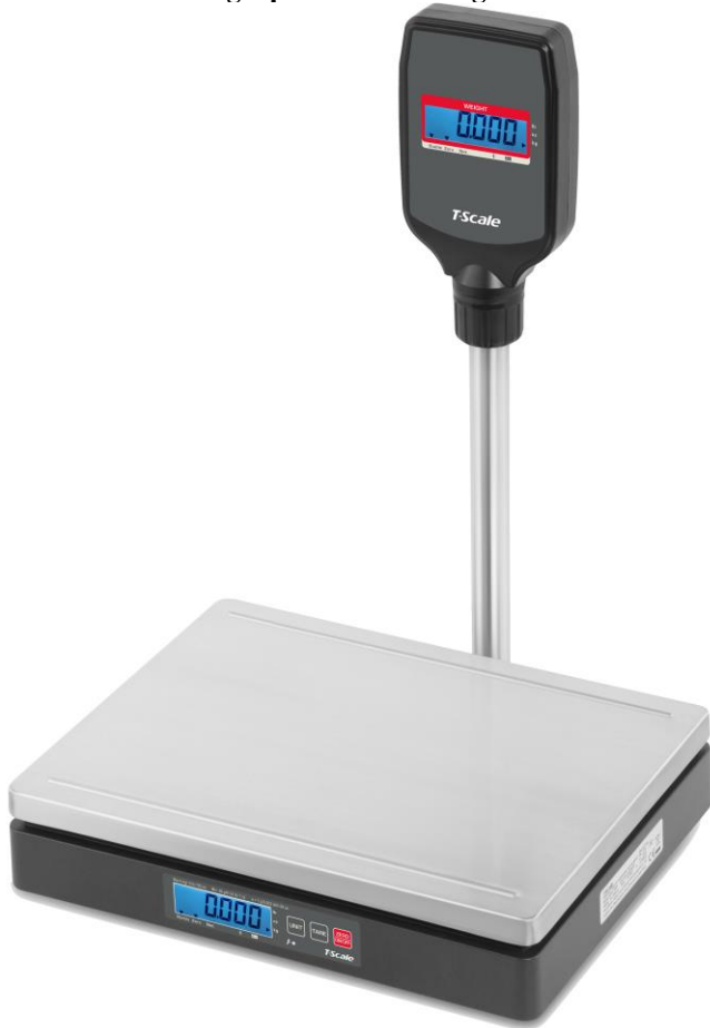
Typical Model DL-xy with optional pole mount display (single window) / Modèle typique DL-xy avec écran monté sur poteau en option (fenêtre unique)