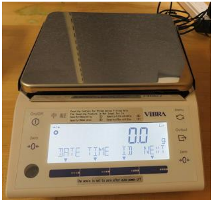
Typical Model ALE1501NC and ALE8200NC / Modèle typique ALE1501NC et ALE8200NC