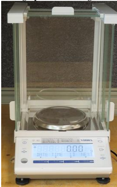
Typical Model ALE322NC / Modèle typique ALE322NC