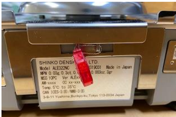
Typical sealing for enclosure of model ALE322NC / Scellage typique de le retrait du couvercle pour le modèle ALE322NC