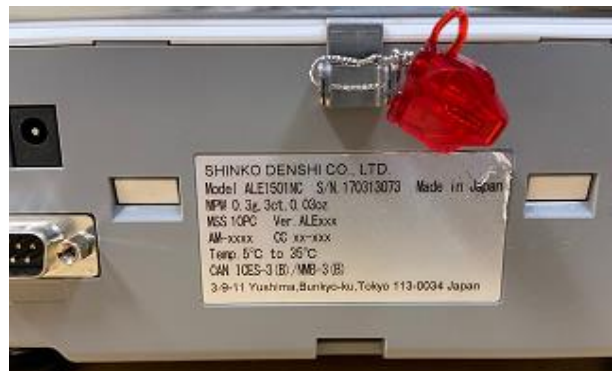
Typical sealing for enclosure of models ALE1501NC and ALE8200NC / Scellage typique de le retrait du couvercle pour les modèles ALE1501NC et ALE8200NC