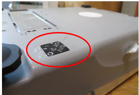
Typical Sealing (circled) / Scellage typique (encerclé)