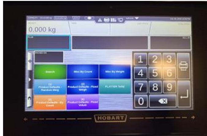
Typical operator display / Affichage typique destiné à l'opérateur