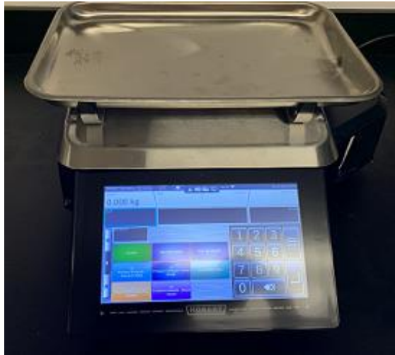
Typical fish platter / Typique Plateau de poisson