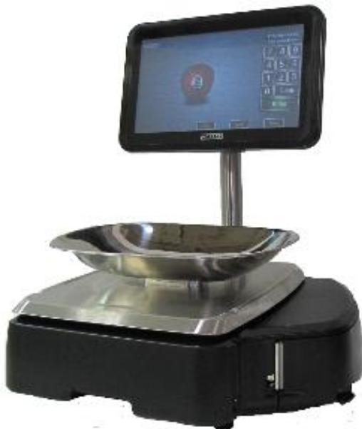
Typical platter with self-serve bowl / Plat typique avec bol en libre service