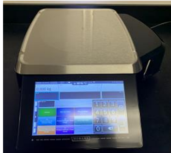
Typical standard platter / Plateau standard typique