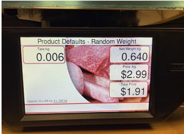
Typical customer Display / Afficheur typique destiné aux clients