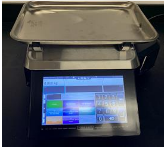
Typical fish platter / Typique Plateau de poisson