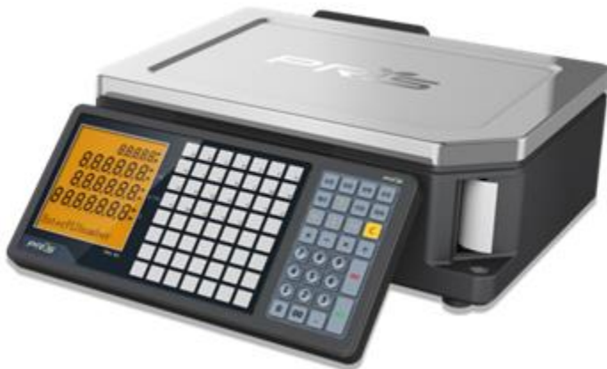
Typical model STL100 / Modèle STL100 typique