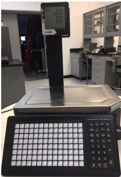
Typical model STL120 / Modèle STL120 typique