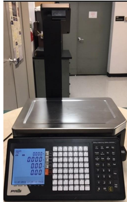
Typical model STL110 / Modèle STL110 typique