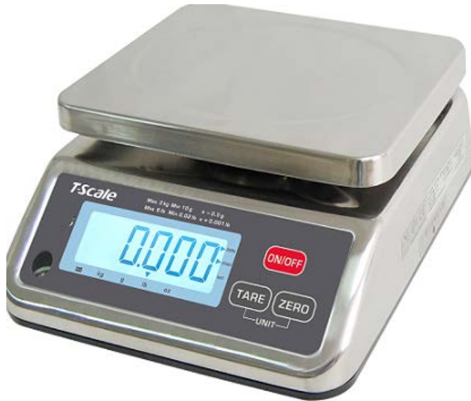
Typical Model S29-xx / Modèle typique S29-xx