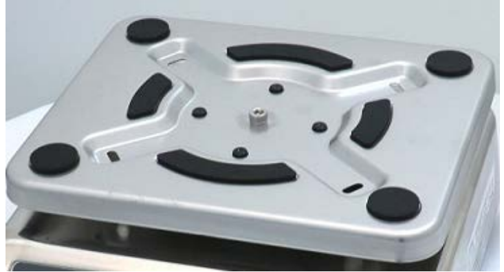
Typical Sub-platter / Sous-plateau typique