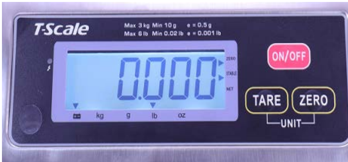
Typical Display / Afficheur typique