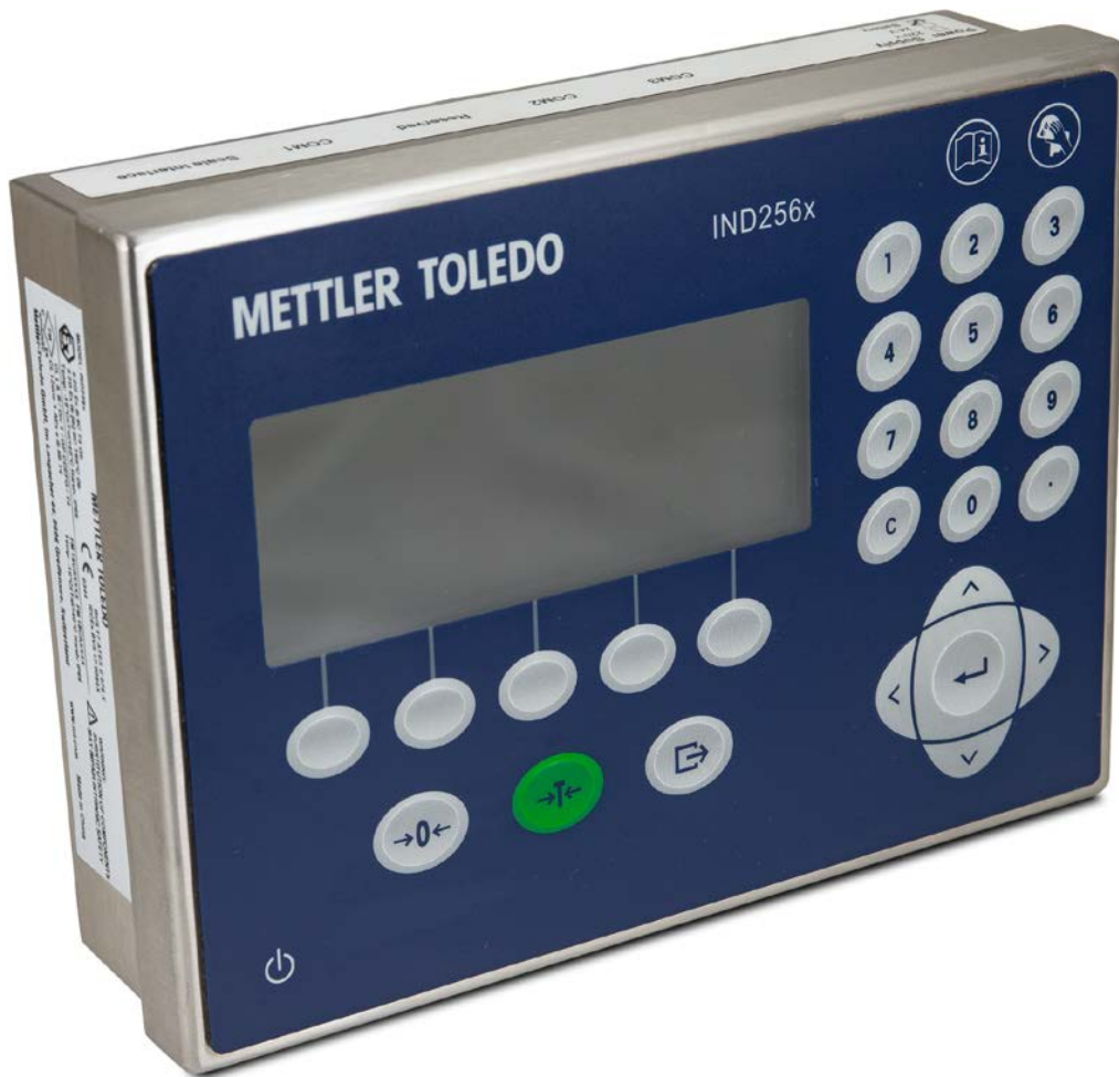
Typical Model / Modèle typique