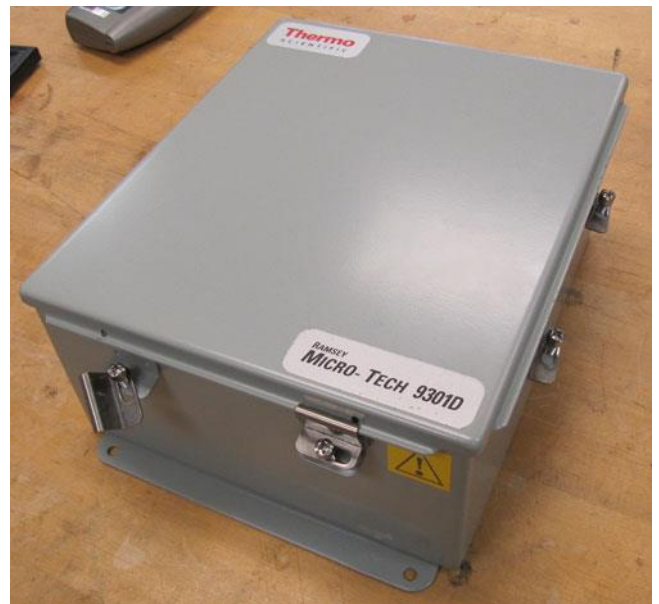
Typical model 9301D junction box / Boite de jonction 9301D typique