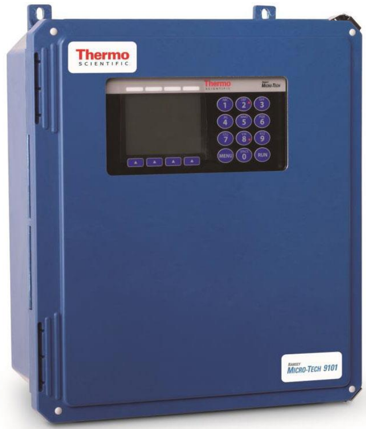
Typical model with fiberglass enclosure / Modèle avec boîtier en fibre de verre typique