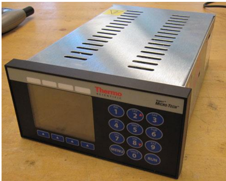
Typical DIN mount / Montage « DIN » typique