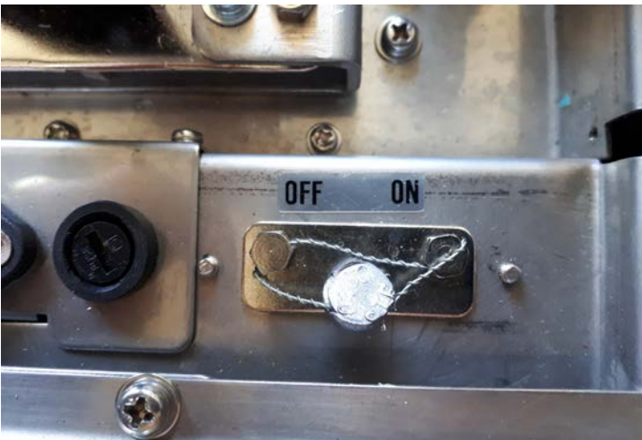
Typical Sealing for RM-5800H on the calibration switch bracket / Scellage typique pour le RM-5800H sur le support du commutateur d'étalonnage