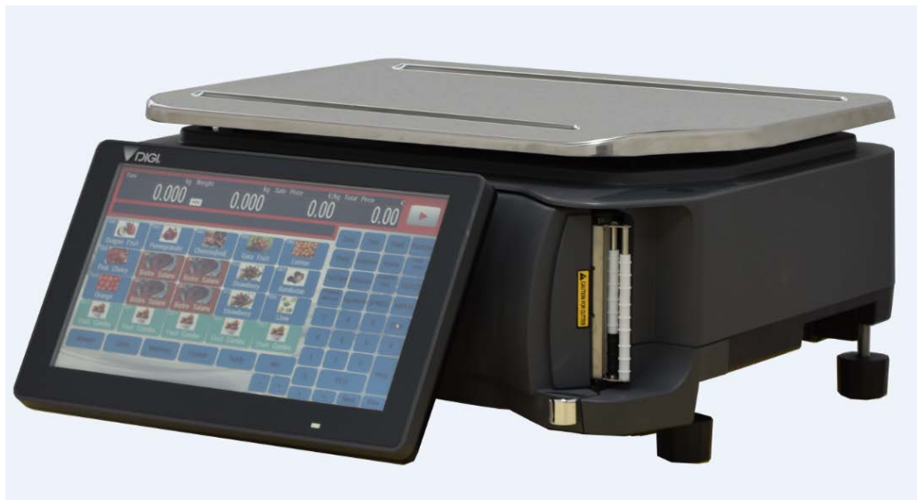
Typical RM-5800B Model / Modèle typique RM-5800B