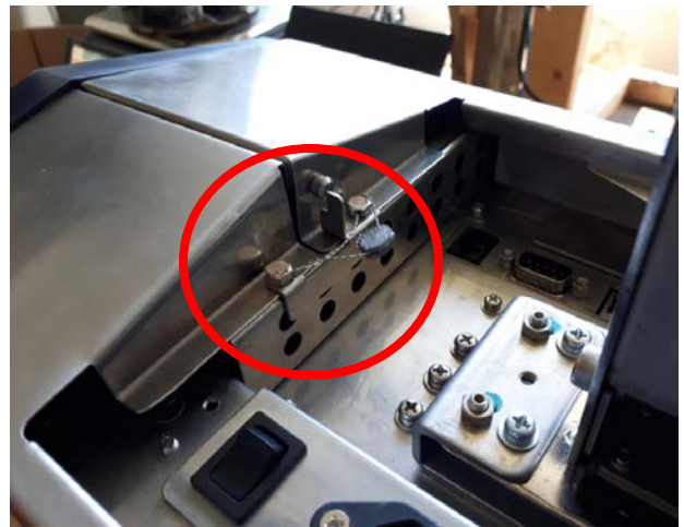
Typical Sealing for RM-5800H on the housing / Scellage typique pour le RM-5800H sur le boîtier