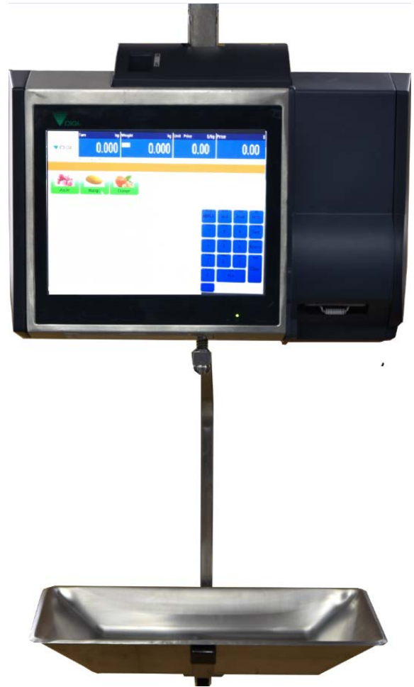
Typical RM-5800H Model / Modèle typique RM-5800H