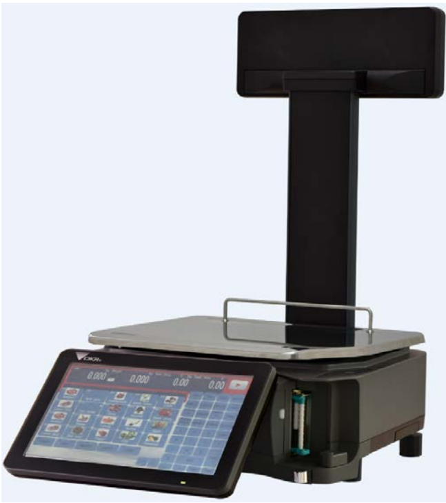
Typical RM-5800P Model / Modèle typique RM-5800P