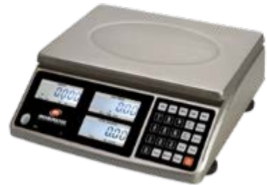
Typical model EHC-PO / Modèle EHC-PO typique