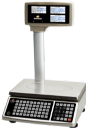
Typical model EHC-PL / Modèle EHC-PL typique