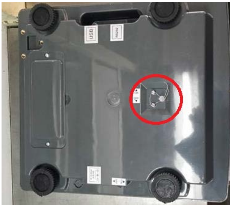
Typical sealing / Scellage typique