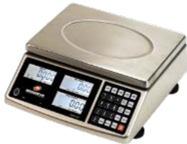
Typical model EHC-PH / Modèle EHC-PH typique