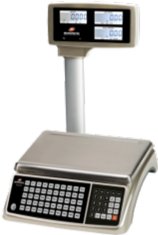
Typical model EHC-PFP / Modèle EHC-PFP typique