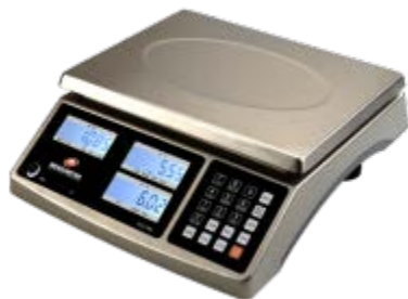
Typical model EHC-PM / Modèle EHC-PM typique