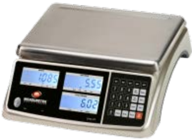
Typical model EHC-PF / Modèle EHC-PF typique