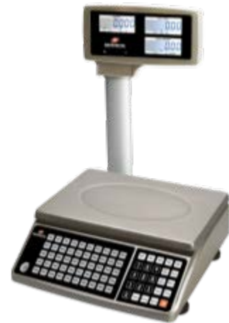
Typical model EHC-POP / Modèle EHC-POP typique