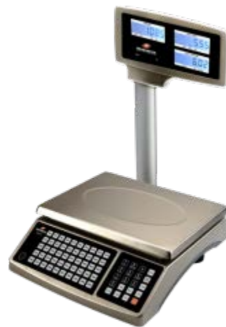
Typical model EHC-PMP / Modèle EHC-PMP typique