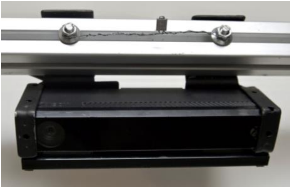
Typical camera, frame, mounting bracket and sealing / Caméra, châssis, support, et scellage typique