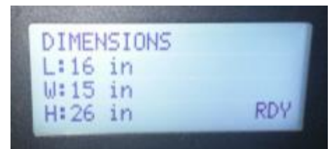
Typical display / Afficheur typique