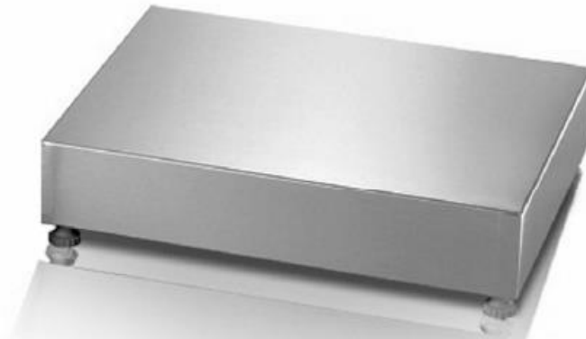
Typical Model / Modèle typique