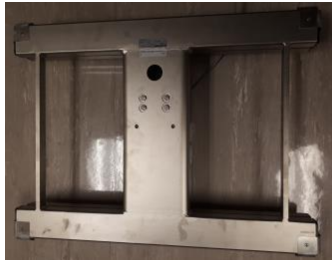
Typical PW 10 AC 3MR 150 kg, PW12 CC3 MR 150 kg and PW 10 AC 3MR 50 kg Sub-platter / Sous-plateaux PW 10 AC 3MR 150 kg, PW12 CC3 MR 150 kg et PW 10 AC 3MR 50 kg typiques