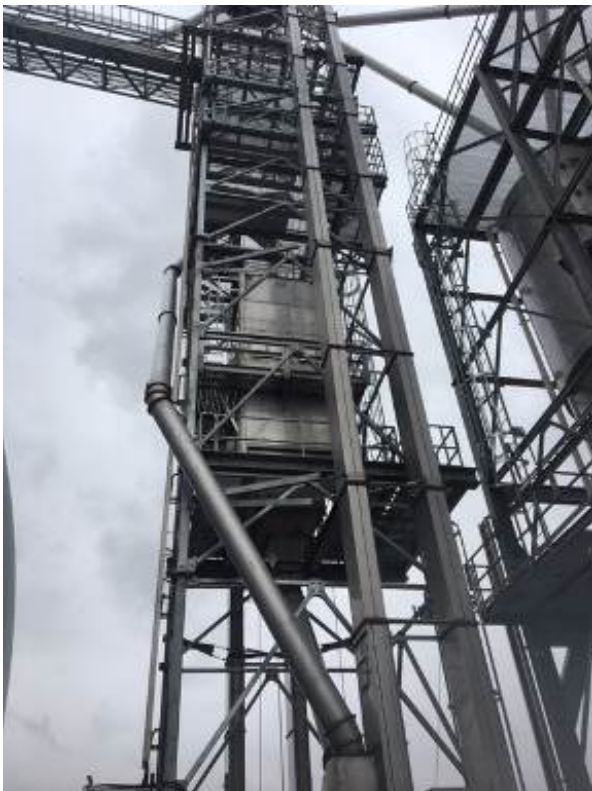
Typical Model / Modèle typique