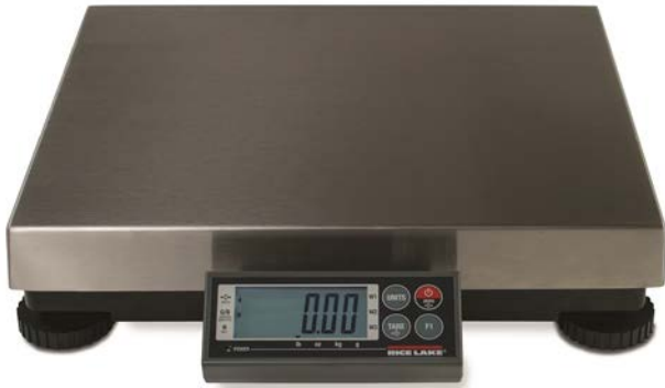
Typical Model / Modèle typique