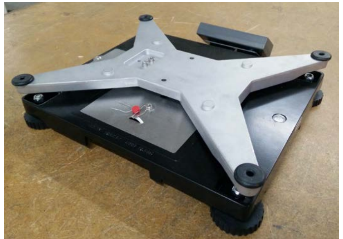
Typical sub-platter / Sous-plateau typique