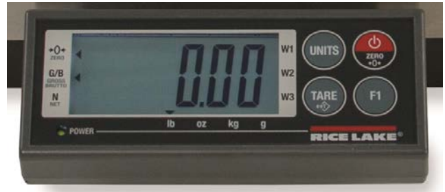
Typical Display / Afficheur typique