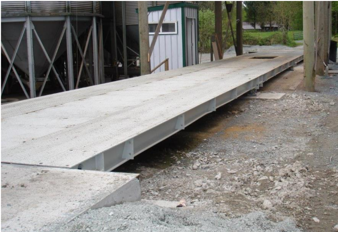
Typical Model / Modèle typique