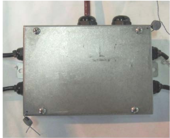
Typical Sealing / Scellage typique