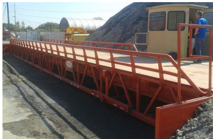
Typical device / Appareil typique