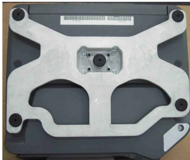
Typical sub-platter / Sous-platneau typique