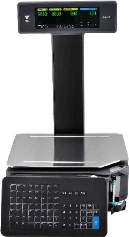
Typical mode SM-120P / Modèle typique SM-120P