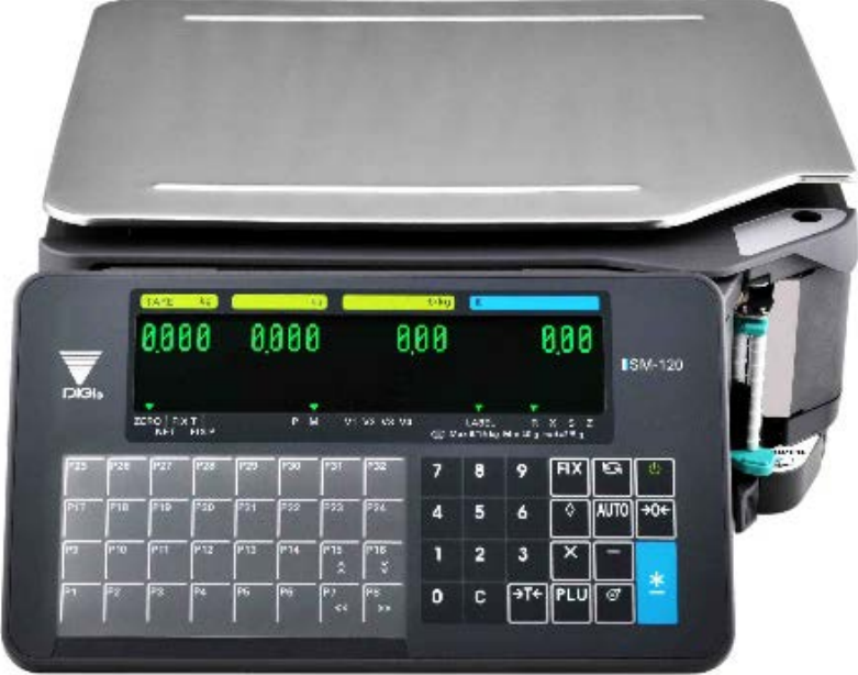
Typical model SM-120B / Modèle typique SM-120B