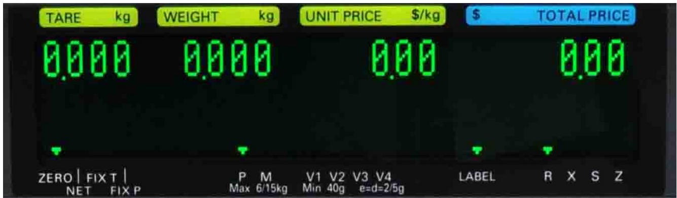
Typical display / Affichage typique