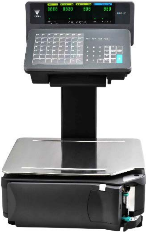
Typical model SM-120EV / Modèle typique SM-120EV