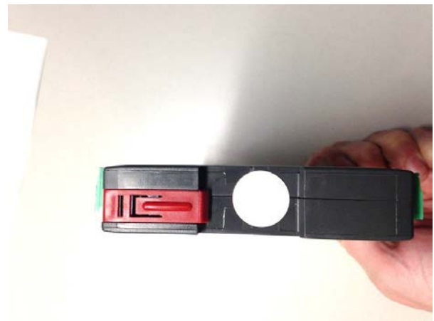
Typical seal position / Position typique du scellé