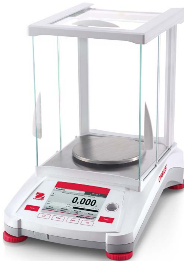
Typical Model AX**3N/E, AX423N or AX224N / Modèle typique AX**3N/E, AX423N ou AX224N