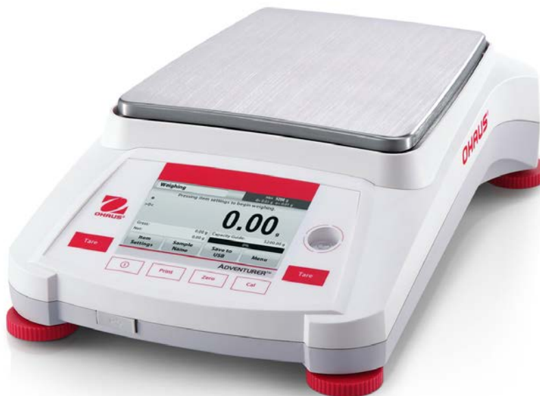
Typical Model AX***1N/E, AX**2N/E or AX***2N/E / Modèle typique AX***1N/E, AX**2N/E ou AX***2N/E