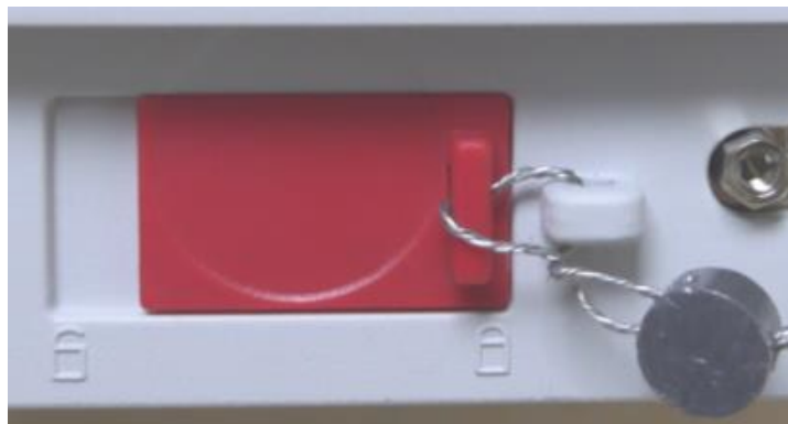
Sealing Method / Methode de scellage