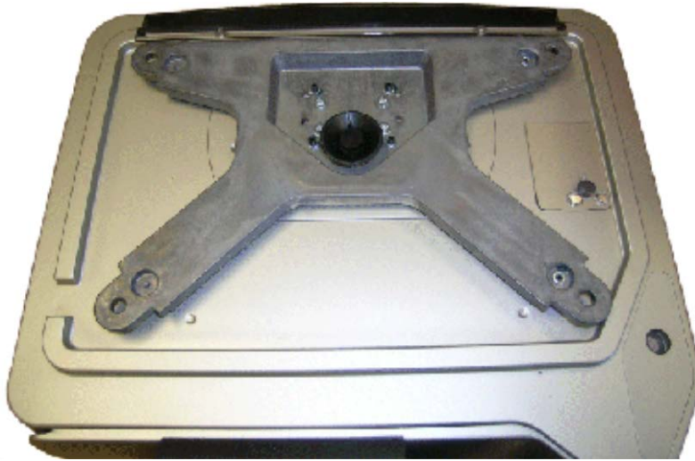
Typical SM-5500**** Alpha (except SM-5500B Split Alpha) subplatter / Sous-plateau typique du modèle SM-5500**** Alpha (sauf SM-5500B Split Alpha)