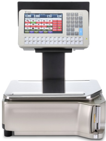
Typical model SM-5500EV Alpha / Modèle SM-5500EV Alpha typique