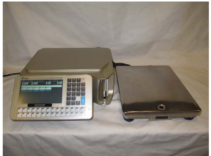
Typical model SM-5500B Split Alpha / Modèle SM-5500B Split Alpha typique