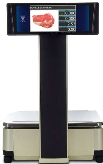
Typical model SM-5500P Alpha / Modèle SM-5500P Alpha typique