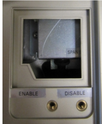
Typical calibration switch access / Mode d'accès à l'interrupteur d'étalonnage typique