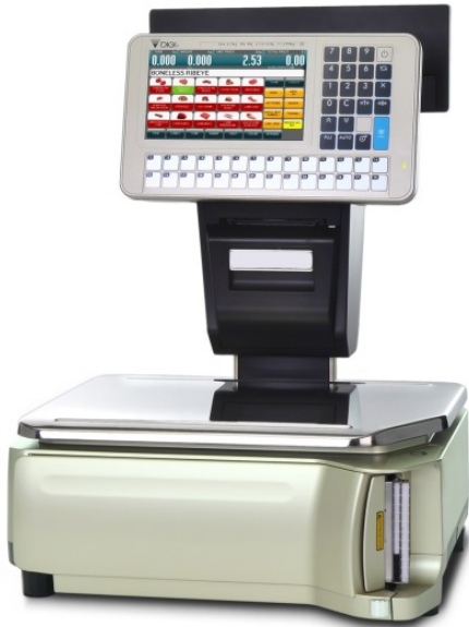
Typical model SM-5500EVP Alpha / Modèle SM-5500EVP Alpha typique