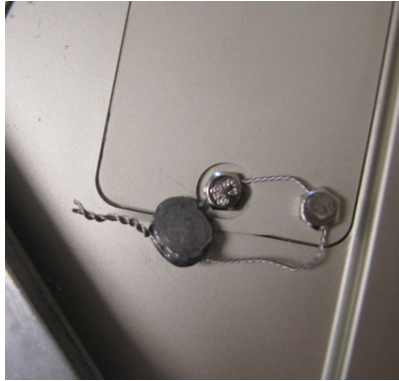
Typical wire and seal method for calibration switch access / Méthode typique de scellage avec fil et scellé pour l'accès à l'interrupteur d'étalonnage