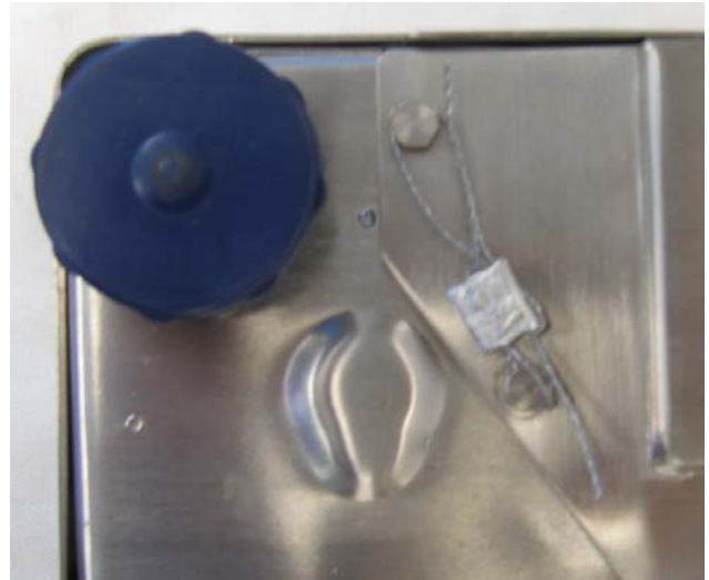
Typical mandatory seal method for the cable of the modular weighing and load receiving element (SM-5500B Split Alpha) / Méthode typique obligatoire de scellage pour le câble du dispositif peseur et récepteur de charge modulaire (SM-5500B Split Alpha)