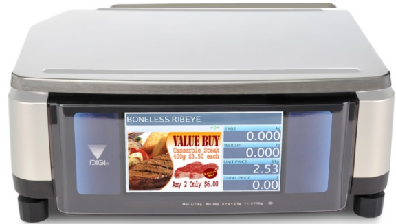
Typical model SM-5500B Alpha / Modèle SM-5500B Alpha typique