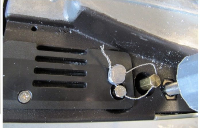
Typical seal method for housing access to prevent calibration switch access / Méthode typique de scellage pour l'accès au boîtier pour empêcher l'accès à l'interrupteur d'étalonnage