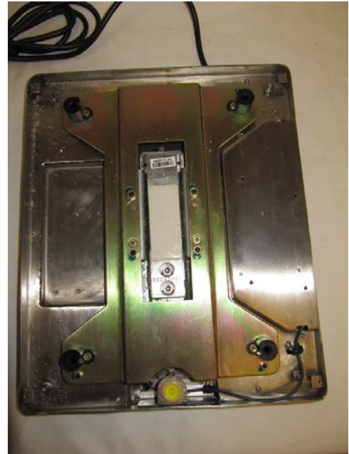
Typical SM-5500B Split Alpha subplatter / Sous-plateau typique du modèle SM-5500B Split Alpha