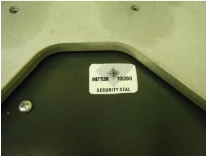
Typical calibration switch sealing with paper seal / Scellage typique de l'interrupteur d'étalonnage avec un scellé papier