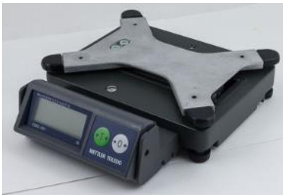
Typical sub-plateau / Sous-plateau typique