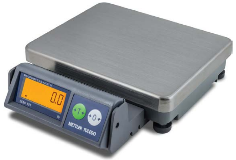
Typical models / Modèles typiques