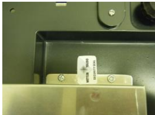
Typical paper seal on the underside of the device / Scellage typique en papier, en dessous de l'appareil