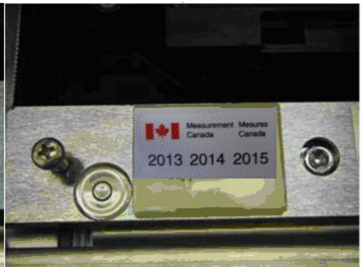
Typical model Ariva sealed with paper seal / Modèle Ariva typique scellé avec un scellé papier