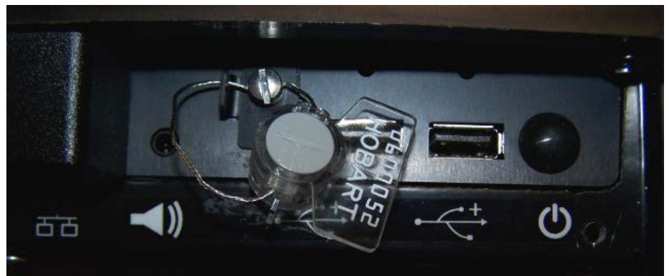
Typical Wire Sealing Method / Méthode typique de scellage avec fil d'acier