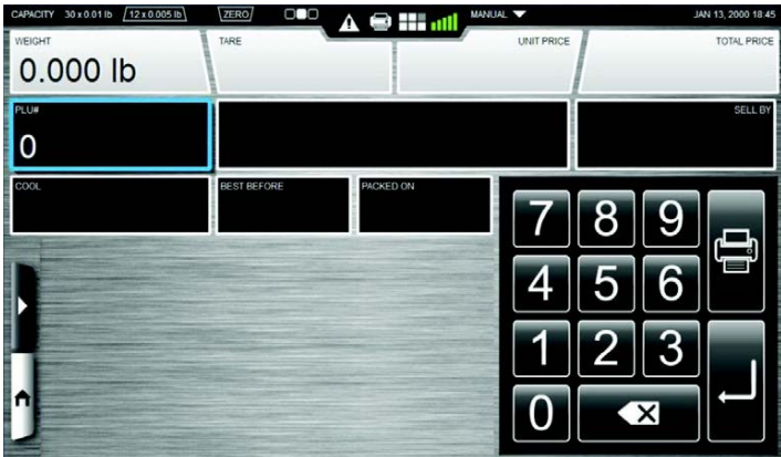
Typical Operator's Display / Afficheur typique destiné à l'opérateur