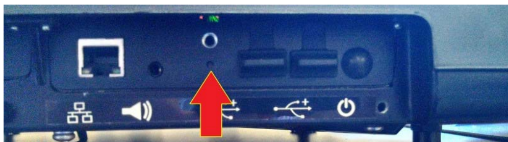
Typical Calibration Switch Location / Emplacement typique du bouton d'étalonnage