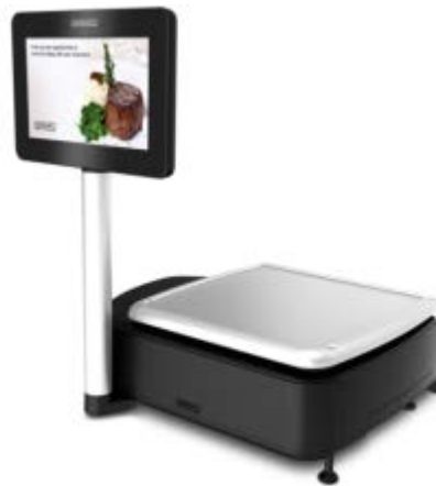
Typical model HTi-10EL$* or HTx-10EW$ / Modèle typique HTi-10EL$* ou HTx-10EW$