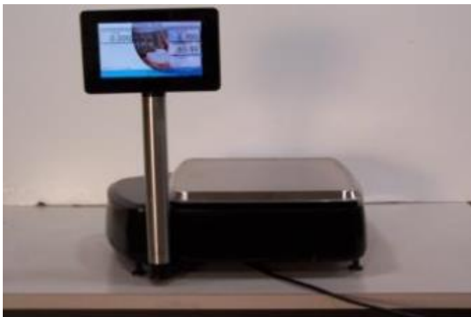
Typical model HTi-7EL$*, HTs-7EL$*, or HTx-7EW$ / Modèle typique HTi-7EL$*, HTs-7EL$*, ou HTx-7EW$