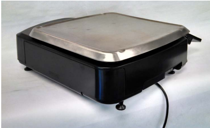
Typical Model HTi-LS / Modèle typique HTi-LS