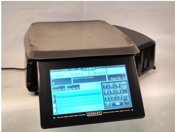
Typical model HTi-7LS / Modèle typique HTi-7LS