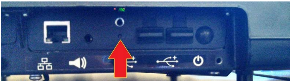
Typical Calibration Switch Location / Emplacement typique du bouton d'étalonnage