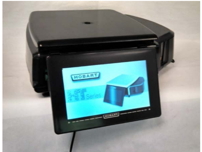
Typical model HTiP-LS / Modèle typique HTiP-LS