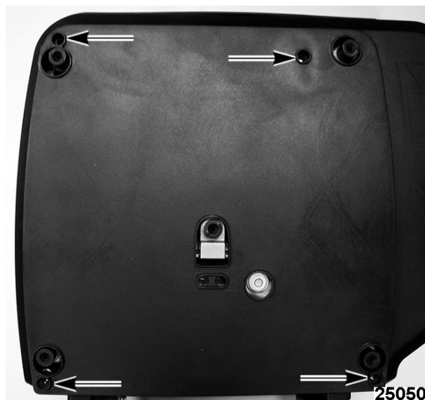
Typical HTi Series Sub-Platter / Sous châssis typique de série HTi