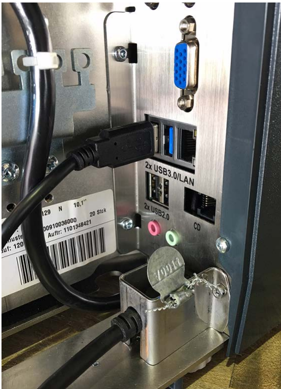
Typical XC 300 load cell cable sealing behind the indicator-printer/ Emplacement typique d'une scellé physique pour du câble de la cellule de pesage derrière l'imprimante-indicateur pour le modèle XC 300