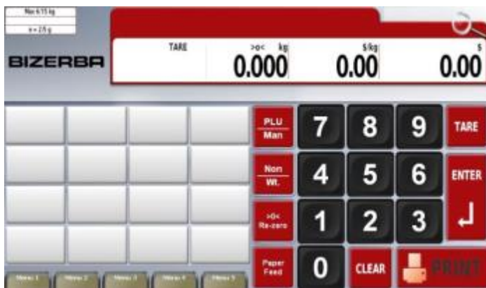
Typical operator's display / Affichage typique destiné à l'opérateur