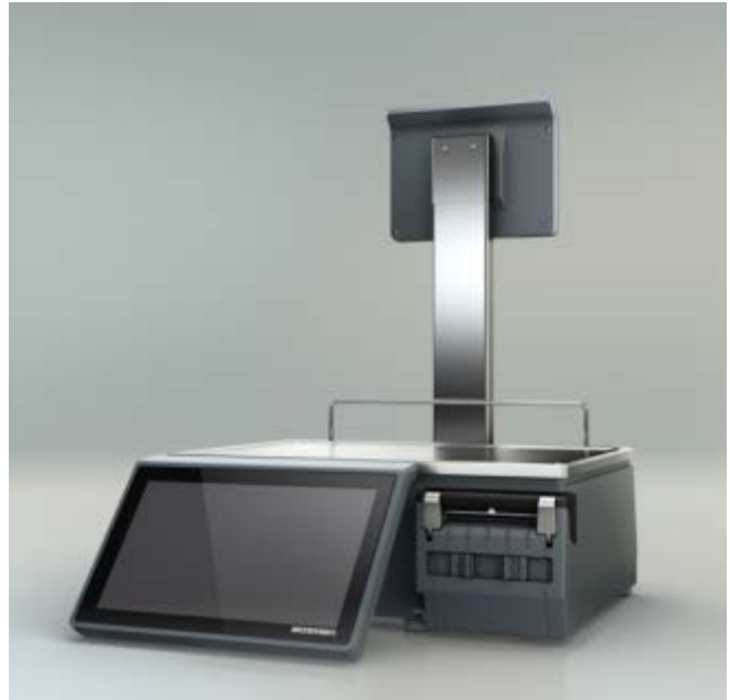
Typical model XC 100P / Modèle typique XC 100P