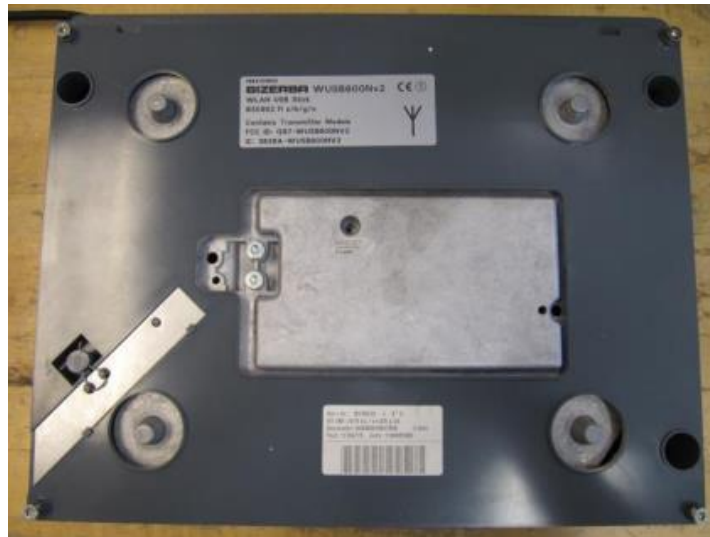
Typical XC 100G and XC 300 subplate and sealing location / Sous-plateau typique et location du sceau physique pour les modèles XC 100G et XC 300