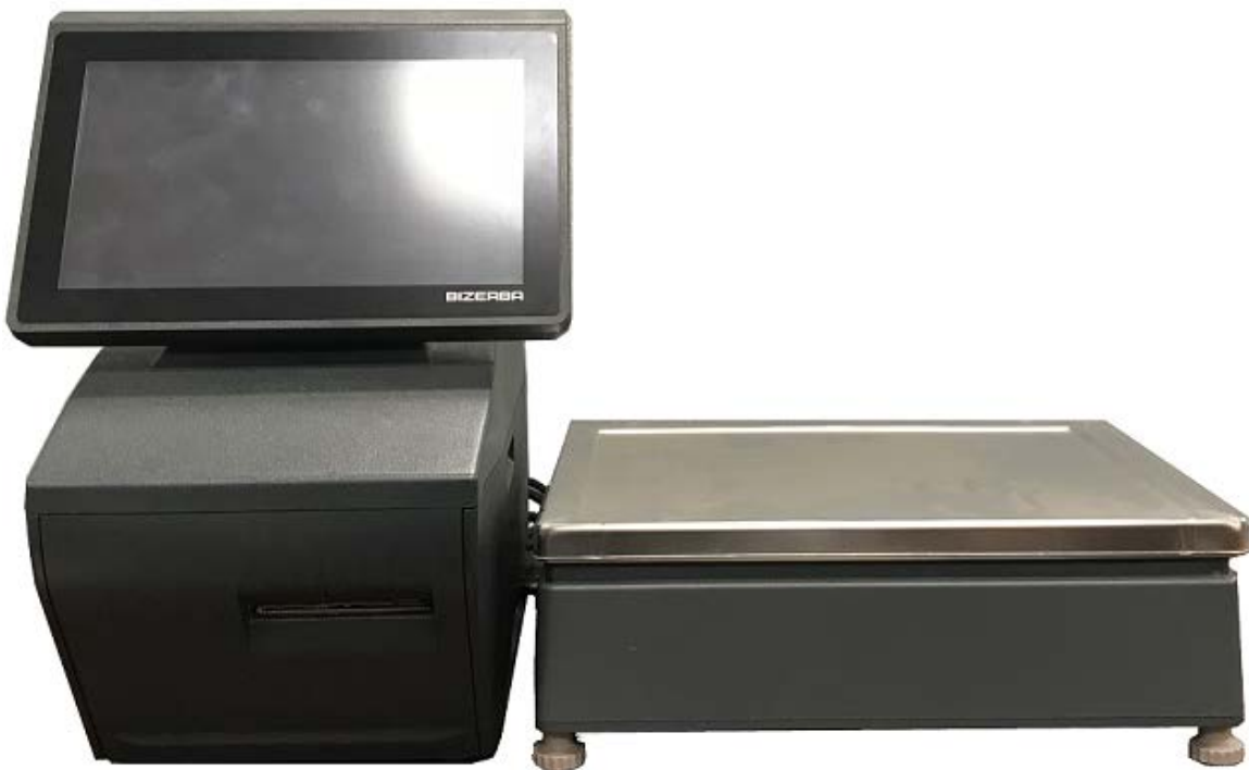
Typical model XC 300 / Modèle typique XC 300