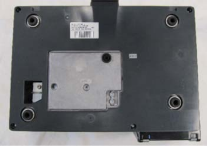
Typical XC 100, XC 100P, and XC 800 subplate / Sous-plateau typique du modèle XC 100, XC 100P et XC 800