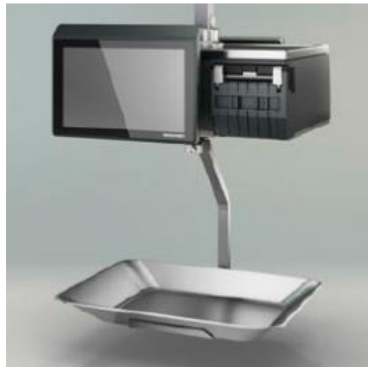
Typical model XC 400 / Modèle typique XC 400