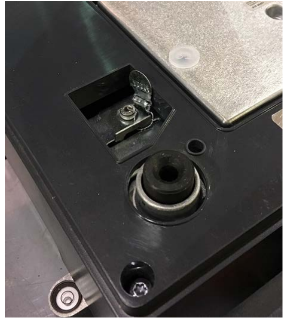
Typical XC 100, XC 100P, and XC 800 sealing location / Location du sceau physique pour les modèles XC 100, XC 100P et XC 800