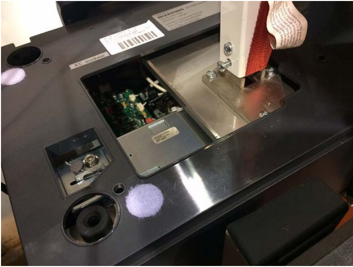
Typical XC 400 sealing location / Location typique du sceau physique pour du modèle XC 400