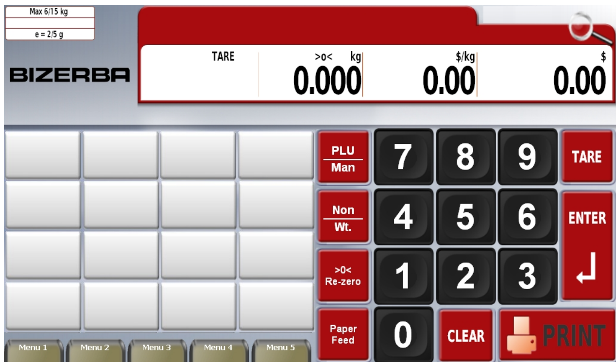
Typical operator's display / Affichage typique destiné à l'opérateur