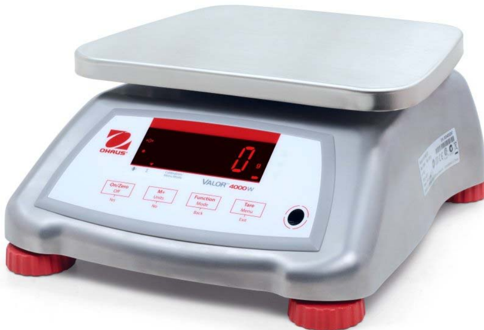
Typical model V41XWE****T / Modèle typique V41XWE****T