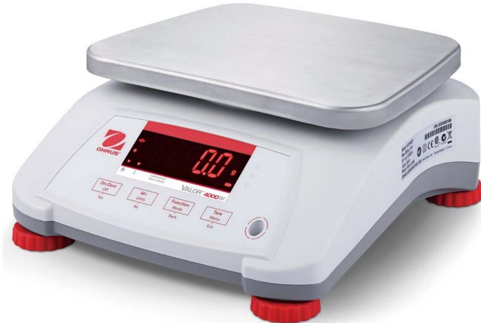
Typical model V41PWE****T / Modèle typique V41PWE****T