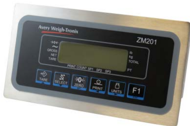
Typical model ZM201 panel mount / Modèle ZM201 typique avec un boîtier monté sur panneau