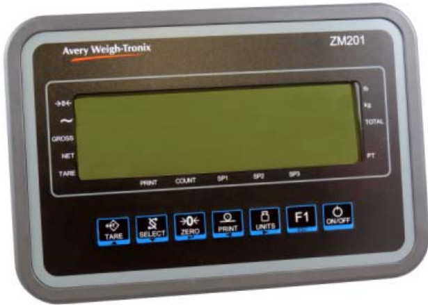
Typical model ZM201 plastic panel mount / Modèle ZM201 typique avec un boîtier monté sur panneau en plastique