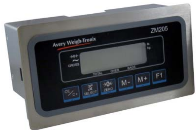
Typical model ZM205 panel mount / Modèle ZM205 typique avec un boîtier monté sur panneau