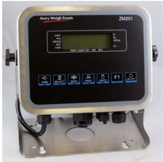
Typical metal desktop model ZM201 / Modèle ZM201 typique avec un boîtier de table en métal