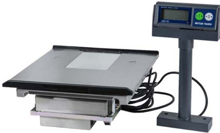
Ariva model with 279mm x 305mm platter / Modèle Ariva avec plateau de 279mm x 305mm