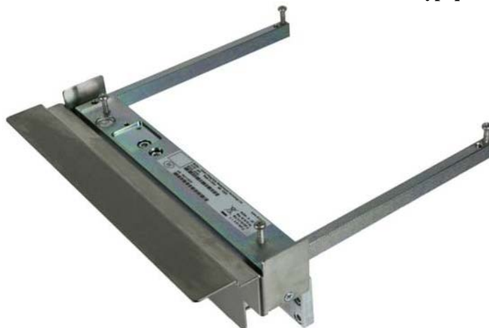
Typical frame of Ariva model / Châssis typique du modèle Ariva