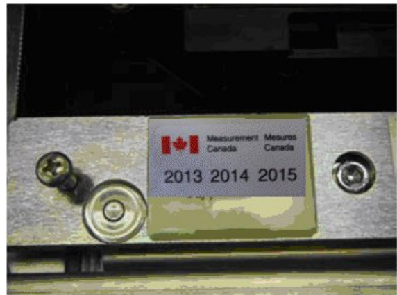
Typical model Ariva sealed with paper seal / Modèle Ariva typique scellé avec un scellé papier