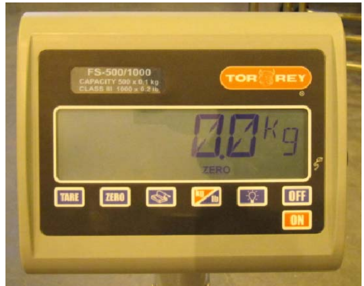
Typical display of model FS-250/500 and FS-500/1000 / Affichage typique des modèles FS-250/500 et FS-500/1000