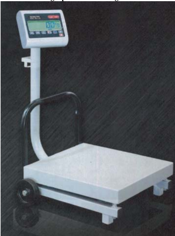
Typical model FS-250/500 and FS-500/1000 / Modèle FS-250/500 et FS-500/1000 typiques