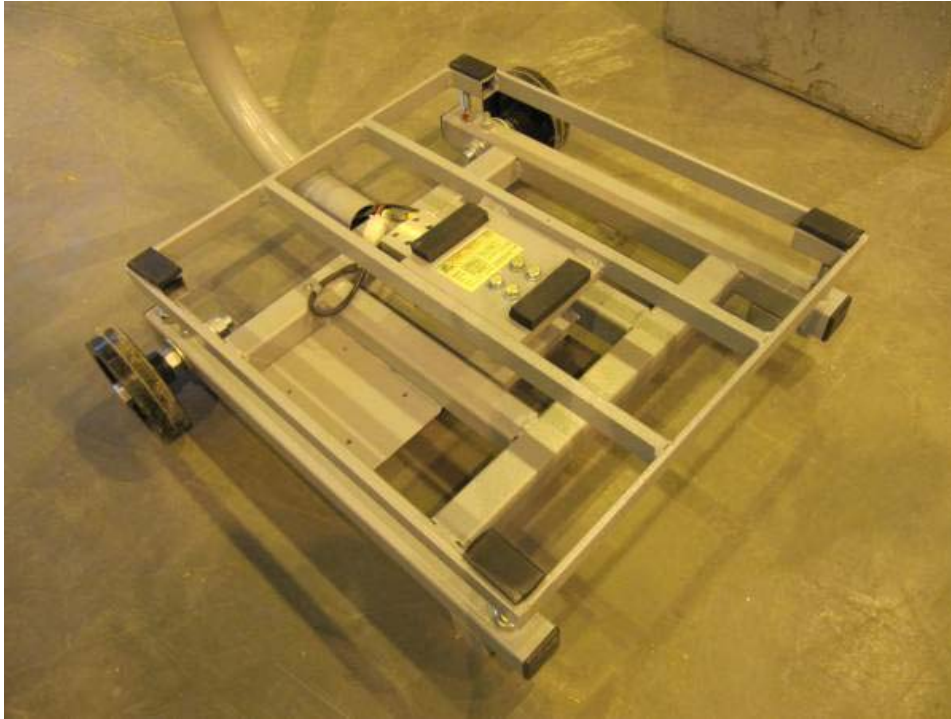
Typical frame of models FS-250/500 and FS-500/1000 / Châssis typique des modèles FS-250/500 et FS-500/1000