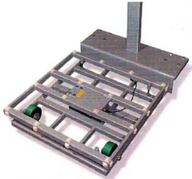
Typical frame of model 640-PS / Châssis typique du modèle 640-PS