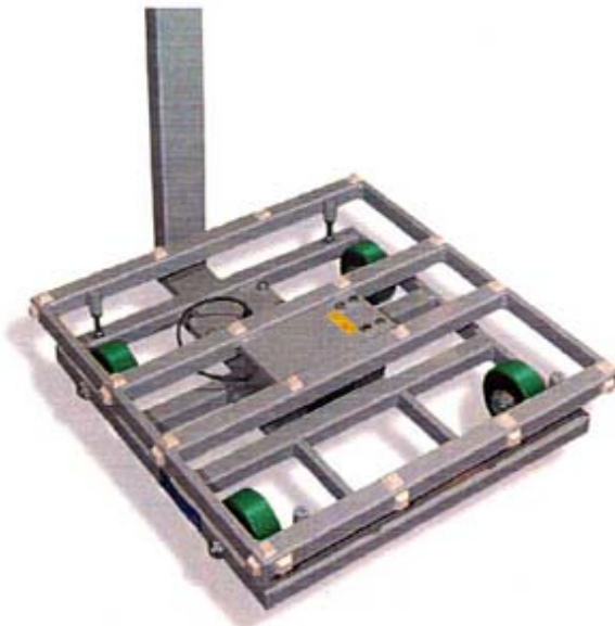
Typical frame of model 640-P / Châssis typique du modèle 640-P