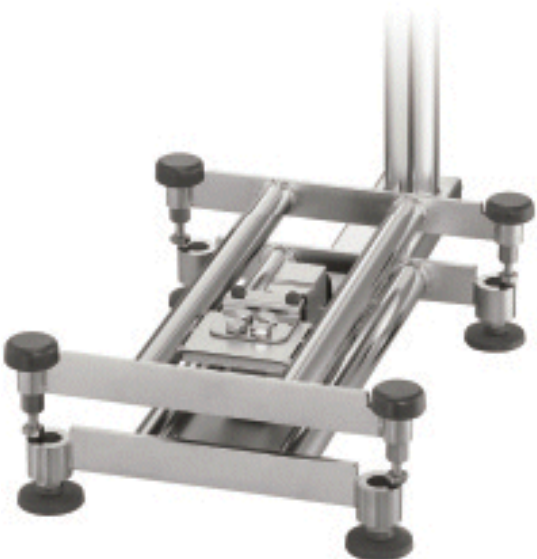
Typical sub-platter / Sous-plateau typique