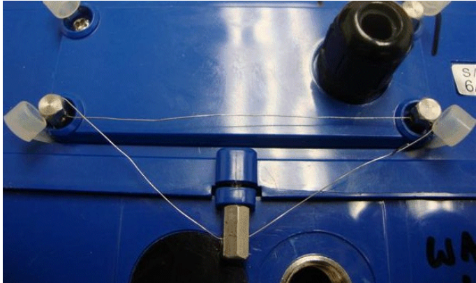
Typical sealing / Scellage typique