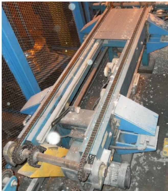
Typical model 117937-1EN + IND560 / Modèle 117937-1EN + IND560 typique