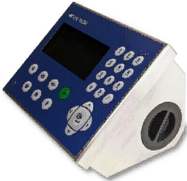
Typical device / Appareil typique