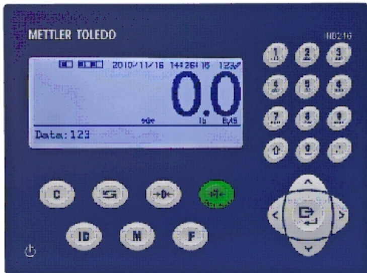
Typical keypad and display / Affichage et clavier typique